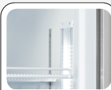
Lampe LED interne verticale