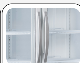
Poignée externe en aluminium