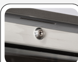
Serrure montée de série